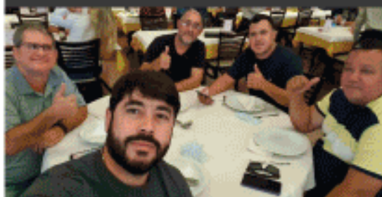
Concessionários de Manaus - AM.