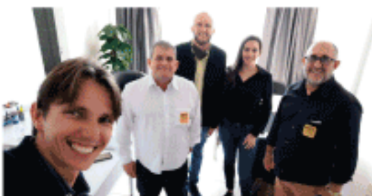
Reunião com concessionários de Santa Catarina.