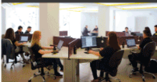
Central de atendimento em Campinas - SP.