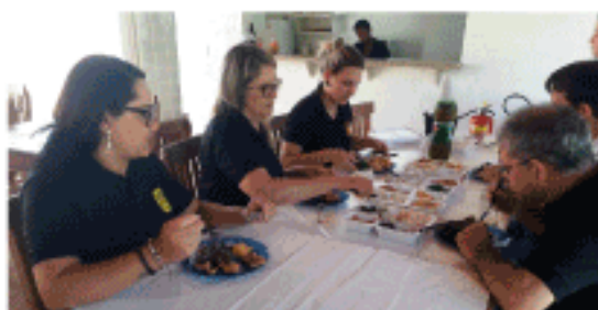
Almoço com colaboradores em Campinas - SP.