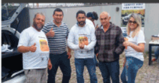
Ação da concessão de Curitiba - PR.