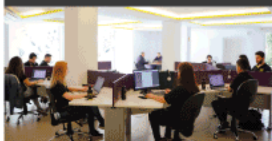
Escritório Administrativo/Suporte em Campinas - SP