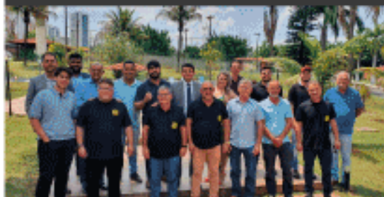
Reunião de Brasília com diretores e concessionários.