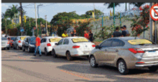
Motoristas MOBBI BRASIL em Brasília - DF.